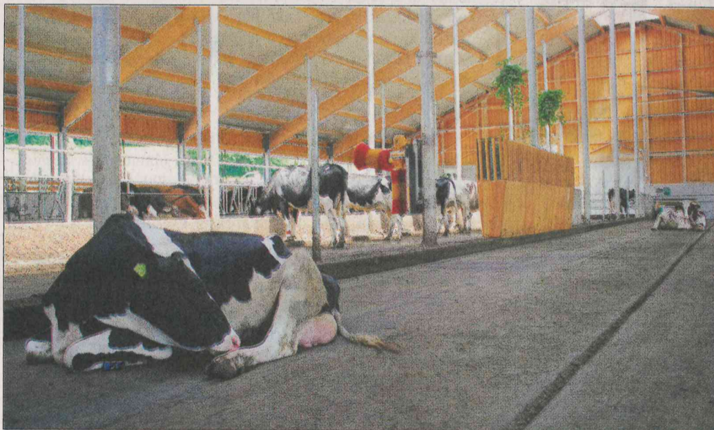
HWF naj bi kravam nudila podobno izkušnjo ležanja v hlevu kot na paši.

Simona je sprva skrbelo to, kako se bodo krave odzvale na HWF, saj je vedel, kako zelo sproščene so bile na globokem nastilju. »Skrb je bila odveč, saj jih je pravi užitek gledati, ko po eni strani tako spokojno ležijo, po drugi pa srečno dirjajo po površini. Prostora imajo ogromno, zrak v hlevu je kakovosten, temperatura optimalna.« Na strehi imajo nameščena dva sedemmetrska ventilatorja, ki se avtomatsko vklopita pri 19 °C in delata na najvišji