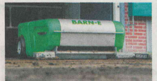
robot za pobiranje hlevskih odpadkov Barn-E

molzišča - hladilne cisterne - avtomatska molža hlevska oprema - odgnojevanje