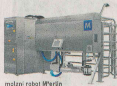
molzni robot M 2 erlin

Za ta posebna prepustna tla na 600 m 2 je odštel 80.000 evrov, vendar je vredno omembe, da je pred to naložbo na nastilj porabil po 2000 evrov na mesec, kar znaša več kot 20.000 evrov na leto ali drugače – ta tla (HWF) ima v primerjavi s tem stroškom pokrita v štirih letih. »Dolgoročno torej naložba v prepustna tla ni velika, na koncu pa naš hlev s ceno tudi ne bo bistveno odstopal od cene drugega – z globokimi ležalnimi boksi na primer pri enakem številu krav. Je pa res, da v hlevu nimamo veliko jam, ki so običajno naj-